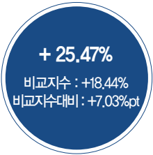
최근 5년 성과