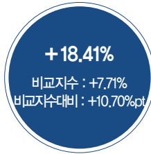
최근 3년 성과