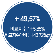
최근 3년 성과