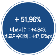
최근 5년 성과