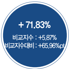
최근 5년 성과