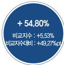
최근 3년 성과