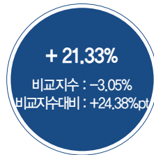
최근 3년 성과