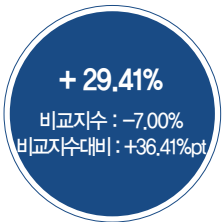
최근 5년 성과