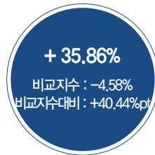
최근 3년 성과