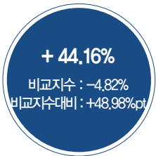
최근 5년 성과