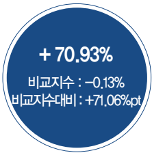
최근 5년 성과