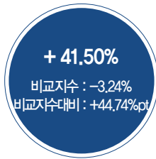
최근 3년 성과