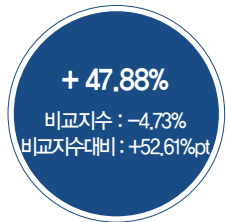
최근 5년 성과