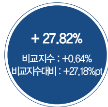
최근 3년 성과