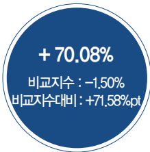
최근 5년 성과