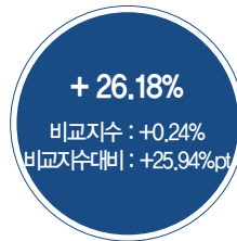
최근 3년 성과