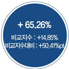
최근 5년 성과