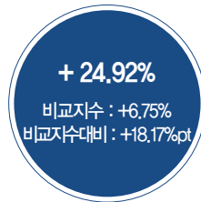
최근 3년 성과