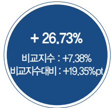
최근 5년 성과