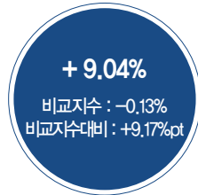
최근 3년 성과