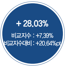
최근 5년 성과