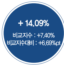
최근 3년 성과