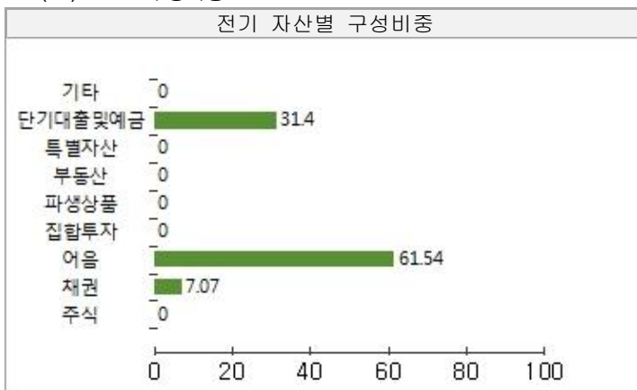
전기 자산별 구성비중